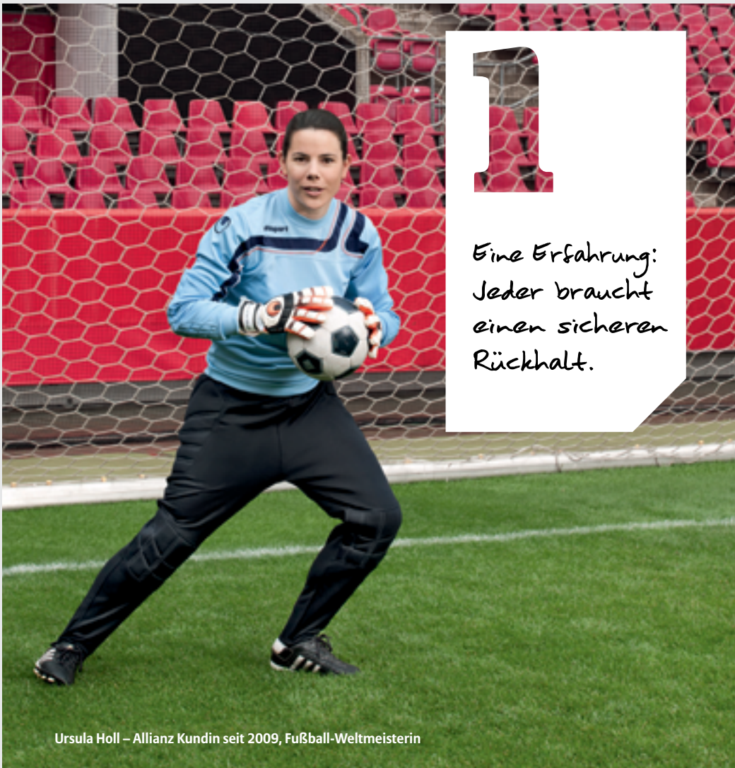
Ursula Holl – Allianz Kundin seit 2009, Fußball-Weltmeisterin

Menschen brauchen Stabilität und Sicherheit. Das gilt besonders für die Altersvorsorge. Kaum eine Anlageform ist so zuverlässig und beständig wie eine Lebensversicherung. Mit der Allianz als starkem Partner bieten wir Ihnen die höchste Leistungs- und Finanzstärke am Markt, eine Gesamtverzinsung deutlich über dem Kapitalmarktniveau und das professionelle Know-how unserer Kapitalanlageexperten. Mehr Informationen erhalten Sie bei Ihrer Allianz vor Ort oder auf www.allianz.de